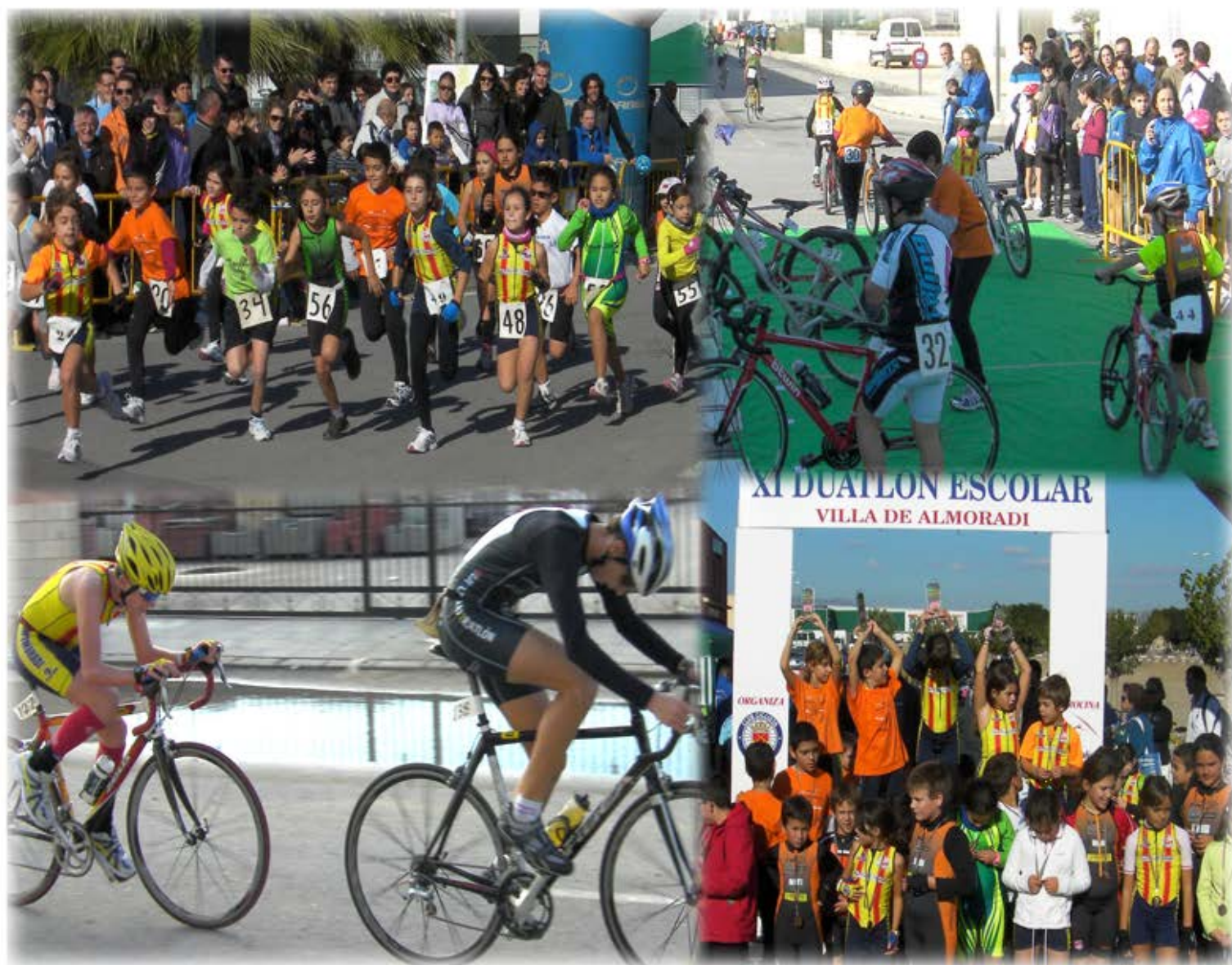
XII DUATLON ESCOLAR VILLA DE ALMORADI

Puntuable para la fase provincial y autonómica de los juegos deportivos escolares de la Comunidad Valenciana